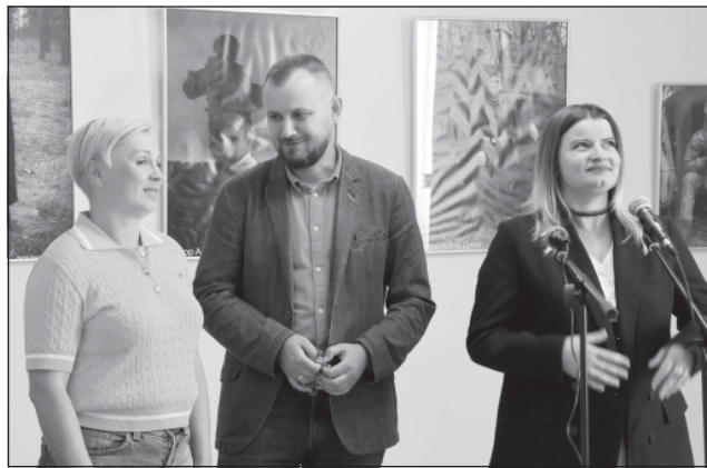
У Вінниці відкрилась фотовиставка «Гвардія опору», на якій представлені фотографії бійців бригади «Червона Калина». Про це повідомили на сторінці бригади.

Герої фотографій — захисники та захисниці України, які брали участь у бойових діях. Вони втілюють у собі збірний образ воїнів різних епох — від часів УНР до сучасності. Світлина передають силу та стійкість воїнів, які стоять на захисті миру та свободи України.