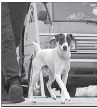
Вінницькі митники спільно з поліцейськими зупинили спробу незаконного розповсюдження канабісу Як повідомили у вінницькій

митниці, в селищі Муровані Курилівці Могилів-Подільського району, за допомогою кінологічної команди та службового собаки митниці фокстер'єра Фокса, правоохоронці затримали місцевого жителя на збуті канабісу.