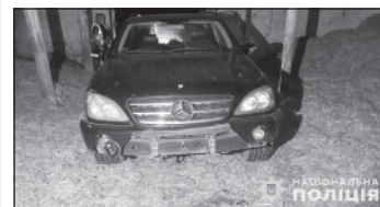
На Вінниччині сталася смертельна аварія, водій зник з місця події, але був знайдений поліцією.

22 вересня у Вінницькому районі сталася трагічна ДТП, внаслідок якої одна жінка загинула, а інша отримала травми. Як повідомили у поліції Вінниччини, аварія сталася при в'їзді до села Кліщів, коли водій автомобіля Mercedes наїхав на скутер, що рухався попереду.