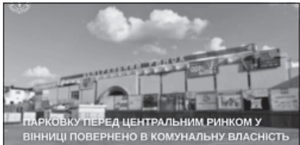
ПАРКОВКУ ПЕРЕД ЦЕНТРАЛЬНИМ РИНКОМ У ВІННИЦІ ПОВЕРНЕНО В КОМУНАЛЬНУ ВЛАСНІСТЬ

Вінницька окружна прокуратура забезпечила виконання рішення Господарського суду Вінницької області, ухваленого за позовом прокуратури про повернення двох земельних ділянок площею 4482 м 2 перед Цен-