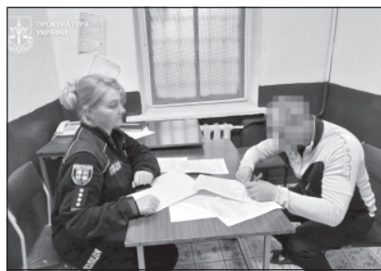
біжний захід — тримання під вартою.

За процесуального керівництва Тульчинської окружної прокуратури чоловіку повідомлено про підозру у згвалтуванні (ч. 3 ст. 152 КК України), за скоєне йому загрожує позбавлення волі на строк від 7 до 12 років. До підозрюваного застосовано запо-