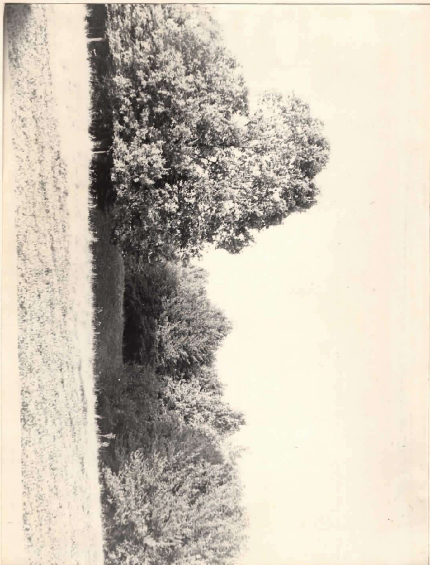
Слов"янське городище. Городище уличів X-XIстст. н.е. Загальний вигляд. Вінницька обл., Іллінецький р-н., с. Дашів.